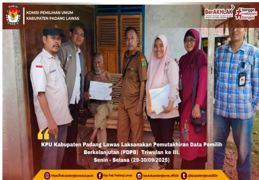
Gambar 22 Kegiatan Coktas pemutakhiran data pemilih berkelanjutan