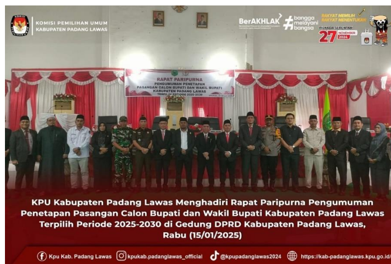
Gambar 8 Rapat pengumuman Penetapan Calon Kepala Daerah terpilih

Pada bagian ini akan menampilkan beberapa rangkaian yang dilaksanakan oleh KPU Kabupaten Padang Lawas dalam menjalankan seluruh kegiatan berdasarkan Perjanjian Kinerja sesuai dengan rencana strategis dan indikator kinerja yang telah disepakati di awal. Berikut beberapa rangkaian kegiatan KPU Kabupaten Padang Lawas yang telah selenggarakan