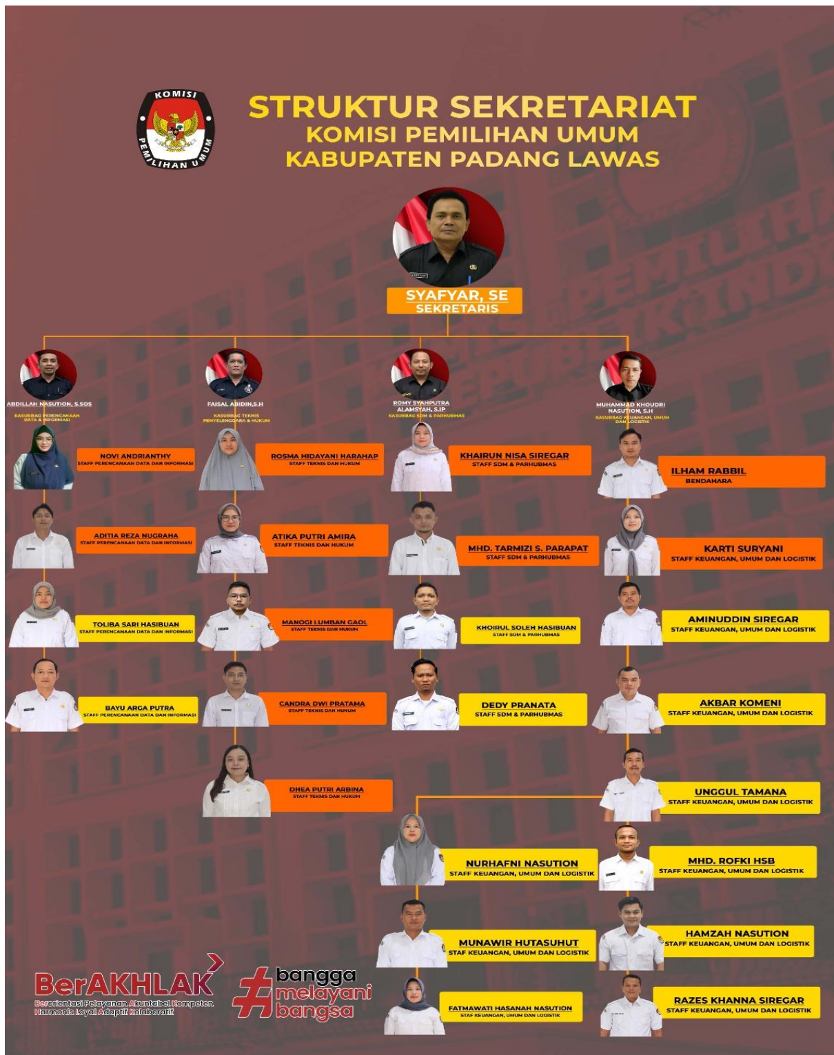
Gambar 3 Struktur Sekretariat KPU Kab Padang Lawas

Detail informasi terkait pembagian anggota pegawai Sekretariat KPU Padang Lawas terdiri dari Jabatan Struktural dipimpin oleh Sekretaris yang membawahi 4 (Empat) Kasubbag dan Kasubbag dibantu oleh seluruh staff ASN. Total ASN Sekretariat KPU Kabupaten Padang Lawas berjumlah 29 orang. yang dapat dilihat pada tabel dibawah