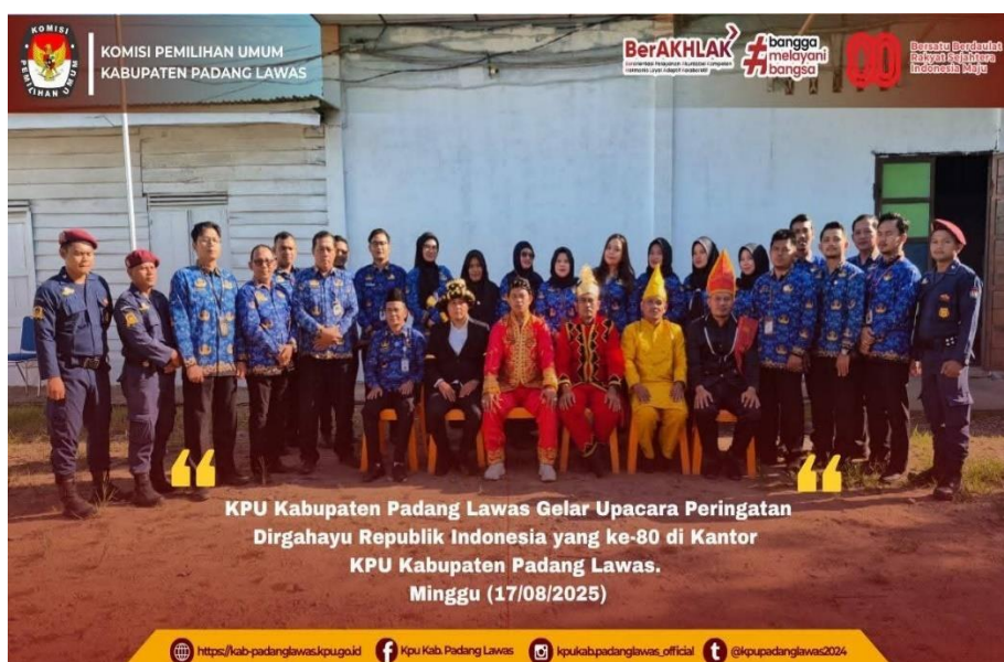
Gambar 17 Kegiatan Hut RI ke 80