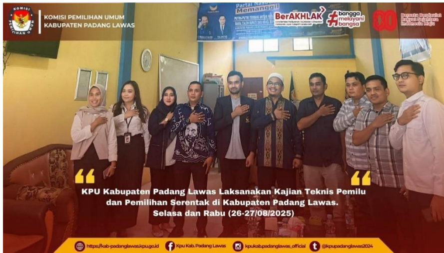
Gambar 18 Kegiatan kajian teknis pemilu ke parpol se kab Padang Lawas