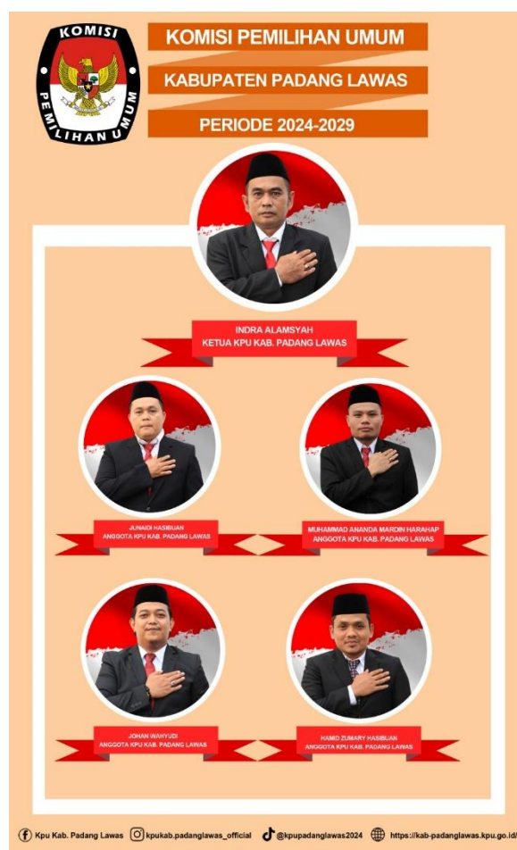
Gambar 2 Anggota KPU Kabupaten Padang Lawas

Berdasarkan Undang-Undang Republik Indonesia Nomor 7 Tahun 2017 tentang Pemilihan Umum, dalam lampiran I, menyebutkan bahwa jumlah anggota KPU Kabupaten Padang Lawas, sebanyak 5 (lima) orang, terdiri atas 1 (satu) orang Ketua merangkap Anggota dan 4 (empat) orang Anggota dengan masa keanggotaan selama 5 (lima) tahun terhitung sejak pengucapan sumpah/janji. Terkait dengan fungsi koordinasi dan komunikasi yang harus dilakukan oleh KPU Provinsi Sumatera Utara terhadap KPU Kabupaten/Kota se-Sumatera Utara, maka disusun Penetapan Divisi, Ketua serta Wakil Ketua Divisi KPU Provinsi Sumatera Utara Periode 2024-2029. Divisi sebagaimana dimaksud, bertugas melakukan monitoring, pengendalian dan evaluasi pada bidang tugas masing-masing sesuai dengan peraturan perundang-undangan dan dibagi dalam 5 (lima) pembagian divisi antara lain: