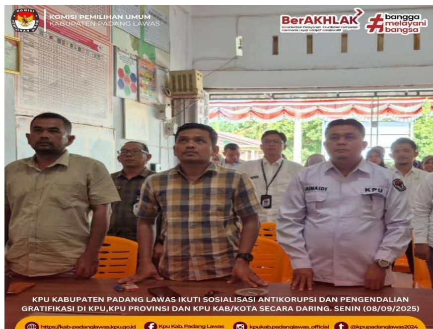
Gambar 20 Kegiatan sosialisasi anti korupsi