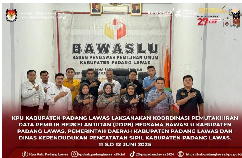
Gambar 14 Koordinasi pemutakhiran data pemilih berkelanjutan bersama Bawaslu