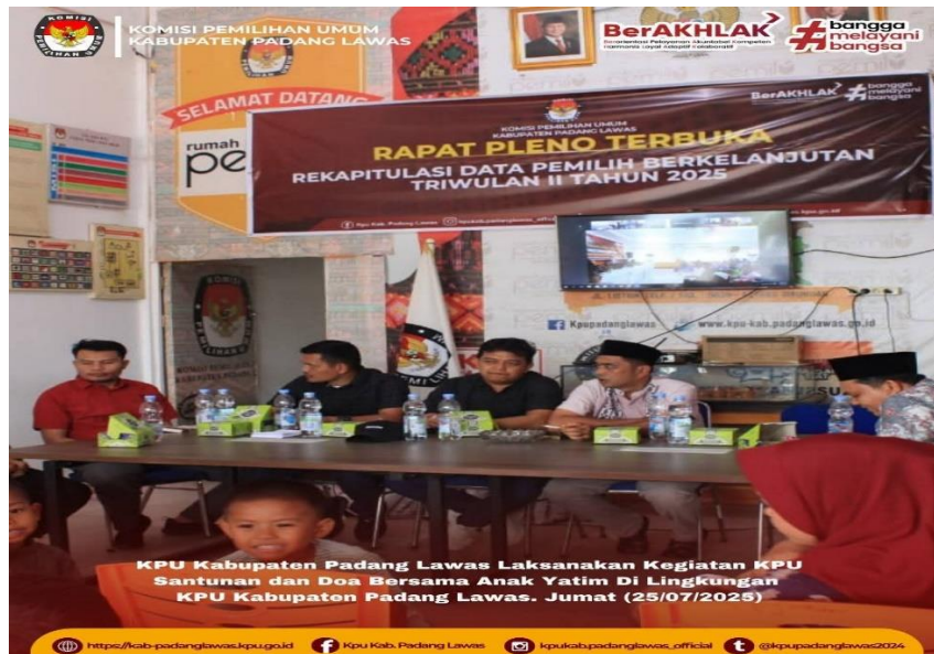
Gambar 15 Santunan anak yatim