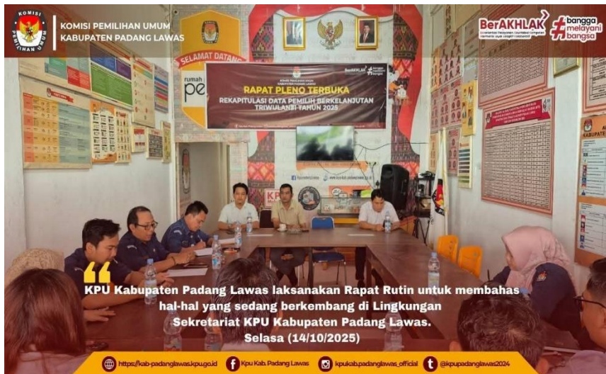
Gambar 24 Rapat rutin internal KPU Kab Padang Lawas