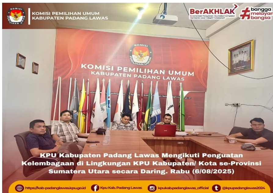
Gambar 16 Kegiatan penguatan kelembagaan se provinsi Sumatera Utara