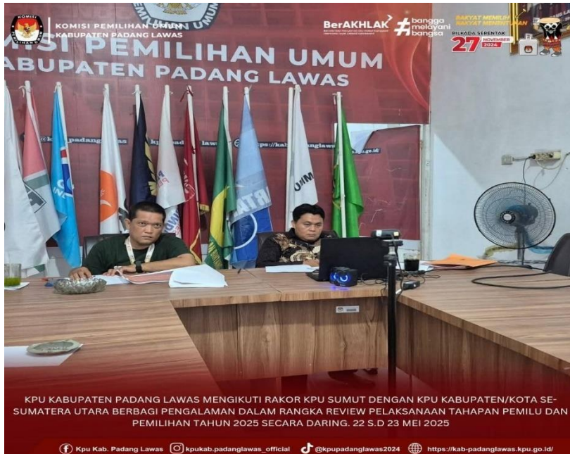
Gambar 13 Rakor Se KPU Sumut review pelaksanaan Pemilu