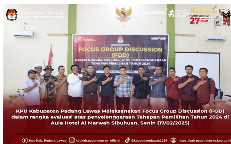
Gambar 9 Kegiatan FGD Evaluasi tahapan pemilu tahun 2024