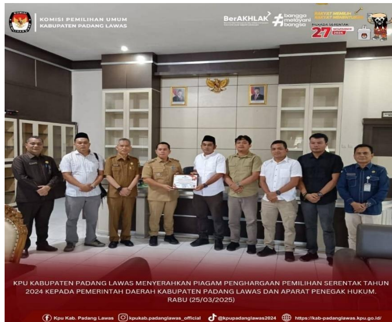
Gambar 11 Penyerahan piagam pemilu serentak