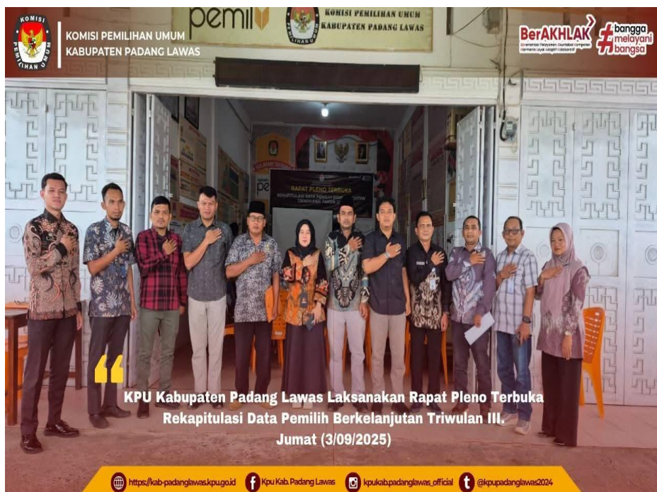
Gambar 23 Kegiatan rapat pleno terbuka PDPB