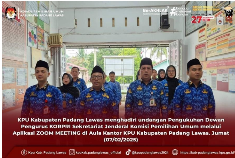
Gambar 10 Kegiatan pengukuhan Dewan pengurus Korpri