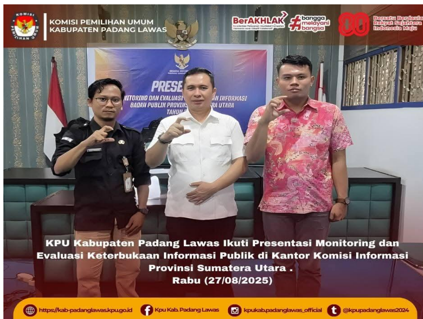
Gambar 19 Kegiatan presensi keterbukaan informasi publik di KPU Sumut