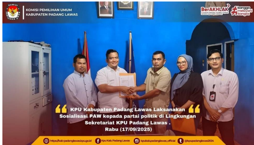
Gambar 21 Kegiatan sosialisasi PAW anggota dewan