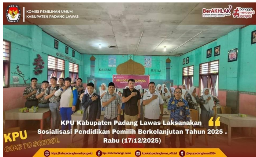
Gambar 25 Kegiatan sosialisasi pendidikan pemilih berkelanjutan